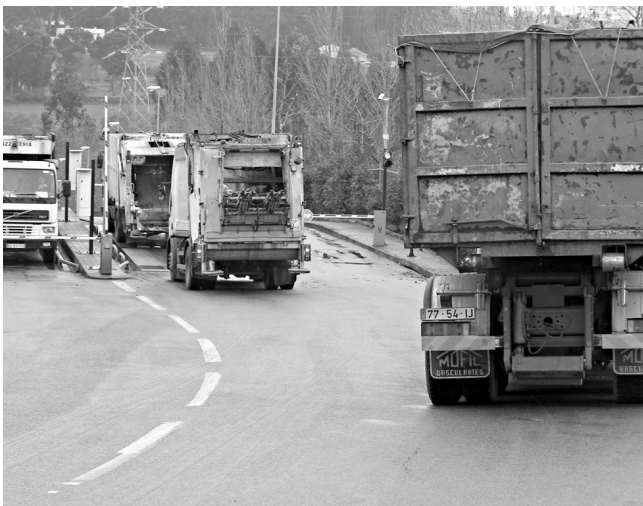
Camións à entrada da Lipor II